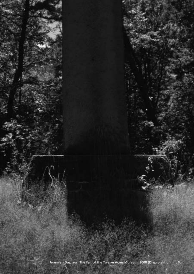
Jeremiah Day, aus: The Fall of the Twelve Acres Museum, 2008 (Diaprojektion mit Ton)