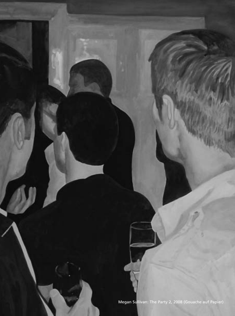
Megan Sullivan: The Party 2, 2008 (Gouache auf Papier)