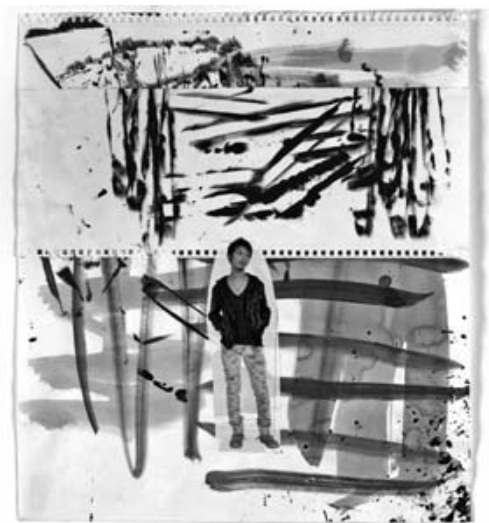
Richard Hawkins: Shinjuku Boy (#7), 2008. Courtesy Galerie Daniel Buchholz, Köln