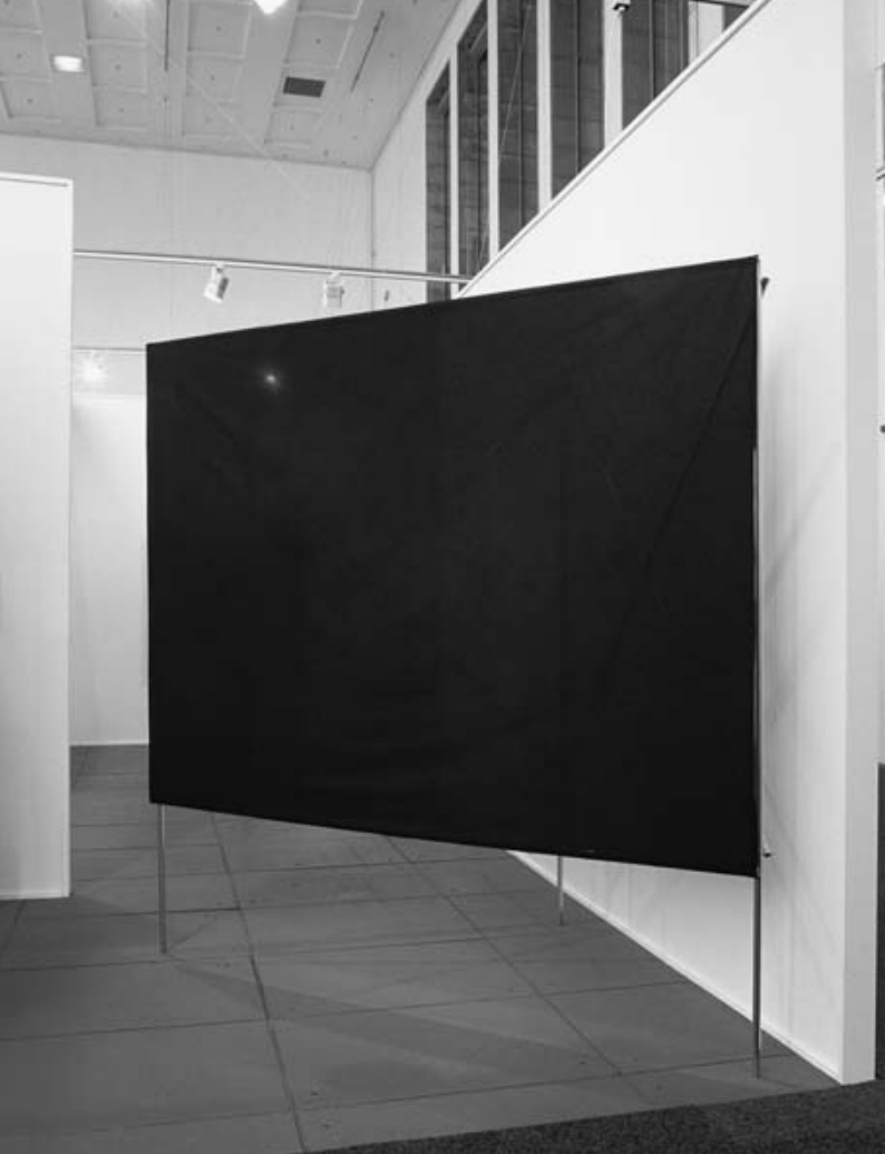
Nadim Vardag: Untitled, 2008 (Edelstahl, Stoff), Installationsansicht, Foto: Nadim Vardag Courtesy Georg Kargl Fine Arts, Wien